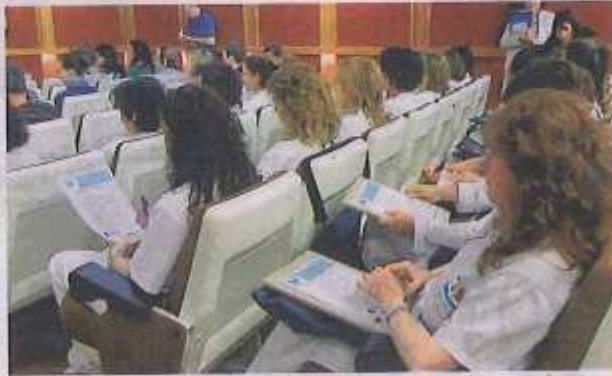
Participantes en el seminario internacional, durante la sesión de trabajo celebrada ayer en Barbastro.