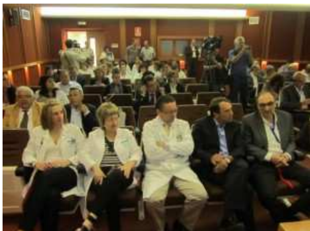
Asistentes a la jornada de telemedicina. JLP.

rurales, dentro del programa europeo RESATER que pretende extender el trabajo con las nuevas tecnologías a las áreas más alejadas de los grandes núcleos sanitarios y mejorar de esta forma la calidad asistencial.