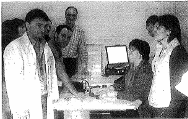
Residentes y especialistas, ayer en la residencia de Campo.

Diario del Alto Aragón / Sábado, 11 de junio de 2011