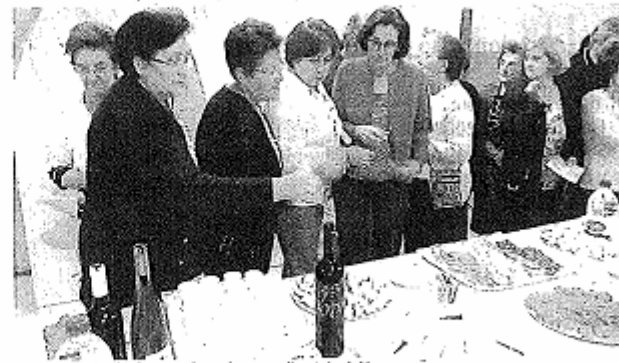
Los vecinos de Bujaraloz degustaron los productos agroalimentarios de Monegros.

Las próximas presentaciones-degustaciones de productos