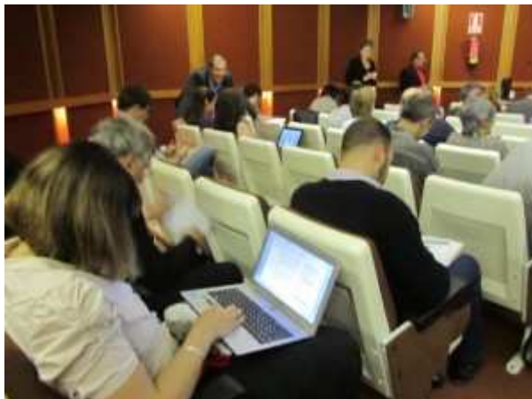
Un centenar de personas en las jornadas en Barbastro.

Entre otras cuestiones, durante la jornada de ayer se presentó el avance del proyecto RESATER y la evaluación de un proyecto de telemedicina. Posteriormente, el presidente del Instituto Europeo de Telemedicina, Louis Lareng, habló sobre 'El reto de la telemedicina' y se presentó el proyecto 'Sistema Transfronterizo de Información para la Prevención en los Pirineos' (STIPP), a cargo del miembro del ITA, Javier Huarte.