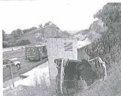
Estado en el que quedó el coche tras el accidente.

BENABARRE. Una persona resultó herida tras perder el control del vehículo que conducía, chocar contra la marquesina de la parada del autobús en Benabarre, en la que no había nadie en el lugar del choque, y acabar volcado entre esta y el túnel trasero. En el lugar del accidente se personaron los bomberos de la Comarca de la Ribagorza y efectivos de la Guardia Civil. El hombre fue evacuado al hospital de Barbastro. El rescate del vehículo accidentado requirió especialmente laborioso ya que se tomaron medidas para evitar daños a la marquesina.