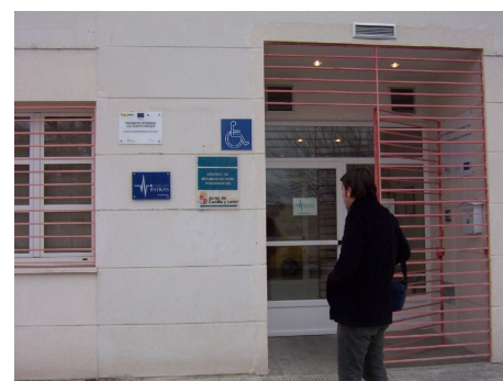
CRPS de Zamora.

Una de las actividades realizadas en el marco del seminario fue la visita de estudio al Centro de Rehabilitación Psicosocial de Fundación INTRAS situado en la ciudad de Zamora. En este recurso, los asistentes pudieron conocer dos herramientas de telemedicina que se testarán en la fase de implementación del proyecto: El programa de rehabilitación cognitiva GRADIOR y la plataforma de psicoeducación y tele-consulta PSICOED.