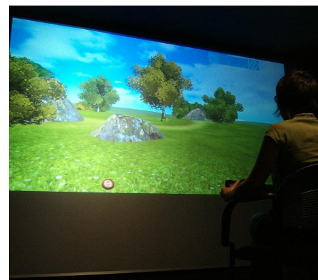
Instalación de Realidad Virtual. CRPS de Zamora

Asimismo, se mostraron los avances y las potencialidades de la realidad virtual en el campo de la e-Salud a través de la instalación de realidad virtual con que cuenta el mencionado centro.